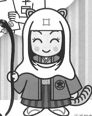
出世法師 直虎ちゃん